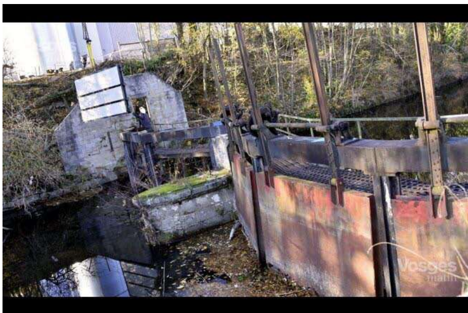
Chaque nouvelle vanne pèse près de 3 tonnes et elles pourront être pilotées à distance grâce à un système hydraulique.

VU 322 FOIS | LE 16/11/2018 À 05:08 | 0 RÉAGIR | f t in e